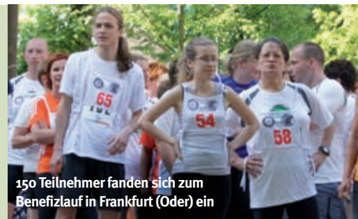
150 Teilnehmer fanden sich zum Benefizlauf in Frankfurt (Oder) ein

als 150 Läufer nicht nur ihren Körpern etwas Gutes: Durch ihre Spenden in Form der Startgelder (Erwachsene sowie Familien 5 Euro, Kinder 3 Euro) unterstützen sie den Kampf gegen die Kinderlähmung. Große Freude herrschte insbesondere bei den Siegern, die sich jeweils über ein gestiftetes Navigationsgerät der Firma Navigon freuen durften, sondern auch bei den Empfängern weiterer Gewinne, die von den Firmen MarsMedia und Electronic Partner (EP) aus Frankfurt (Oder) verlost wurden. Neben Grillstand und Getränkestation war auch für ein buntes Kinderprogramm mit Hüpfburg und Glücksrad gesorgt.