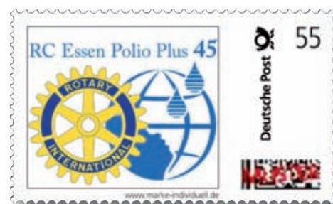
Dies ist die Marke, die der RC Essen in Umlauf gebracht hat. Vor Ausweitung der Aktion sind noch einige Fragen zu klären

Die Marken werden im 20-er Block zu 20 Euro abgegeben. Der Preis setzt sich zusammen aus 11 Euro Portowert, 3 Euro Beteiligung Druck-